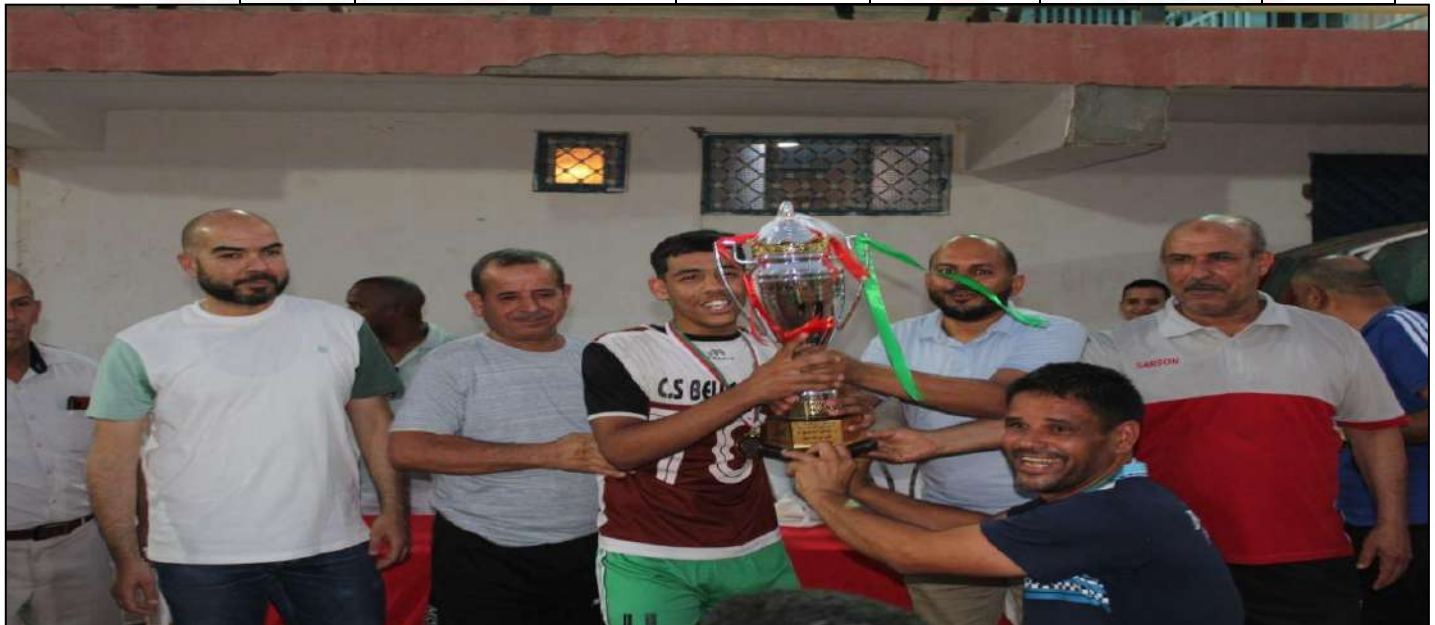
تتويج النادي الرياضي منظر الجميل بطرا جهويا لأول مرة منذ 15 سنة للموسم الرياضي 2023/2024