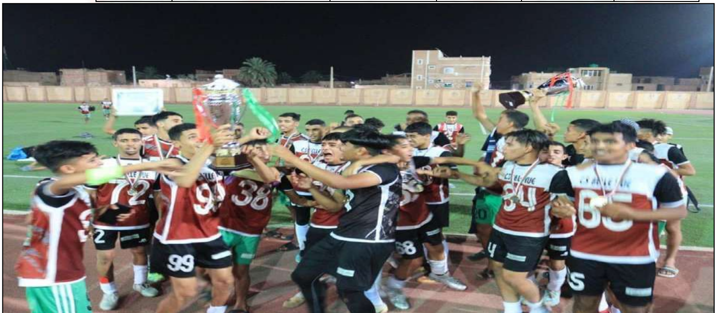
نتيجة النادي الرياضي منظر الجميل بطرا جهويا لأقل من 17 سنة للموسم الرياضي 2023/2024