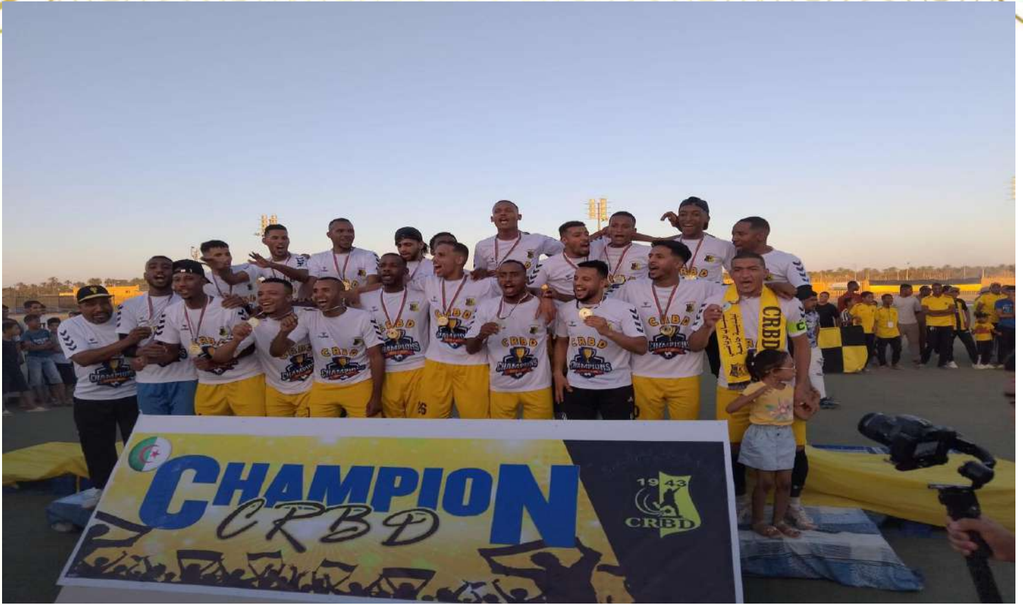
نتيجة فريق شباب جامعة ببطولة الجهوي الأول فوج "أ" للموسم الرياضي 2023/2024