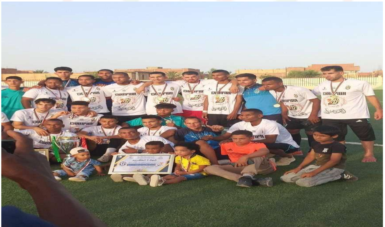
نتيجة المدرسة الكروية امل النزلة ببطولة الجهوي الثاني فوج "ب" للموسم الرياضي