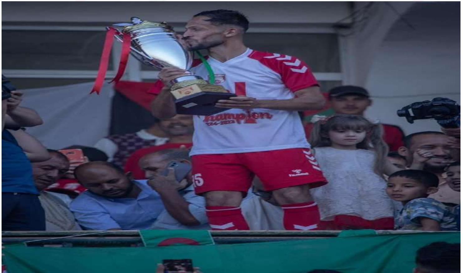
نتيجة فريق اتحاد بلدية الأغواط ببطولة الجهوي الأول فوج "ب" للموسم الرياضي 2023/2024