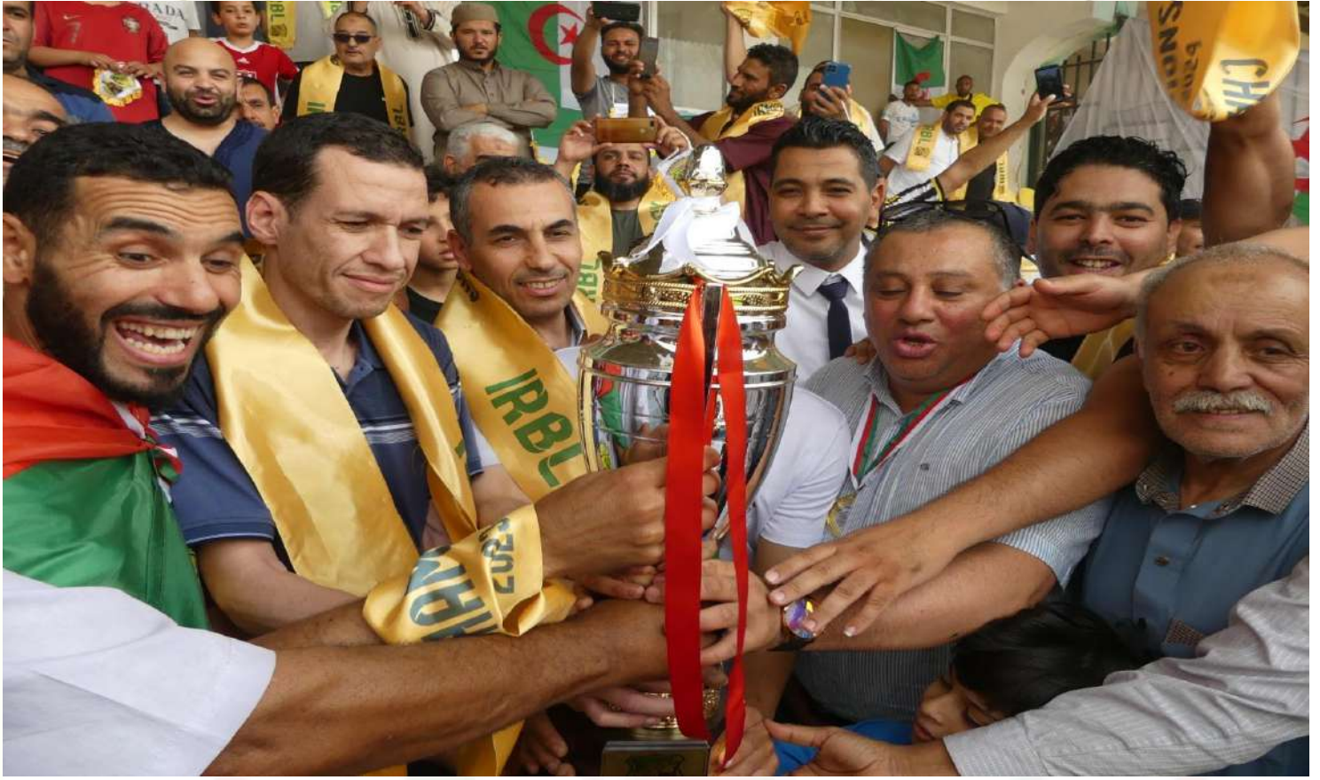
نتيجة اتحاد الرياضي بلدية الأغواط ببطولة الجهوي الثاني فوج "ج" للموسم الرياضي 2023/2024