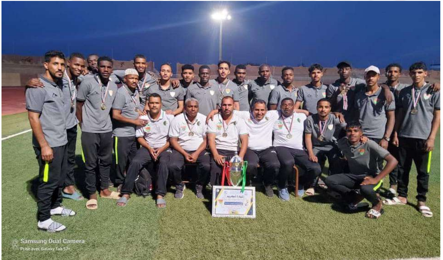
نتيجة صفوف الساحلي تمرست بطولة الجهوي الثاني فوج "د" للموسم الرياضي 2023/2024