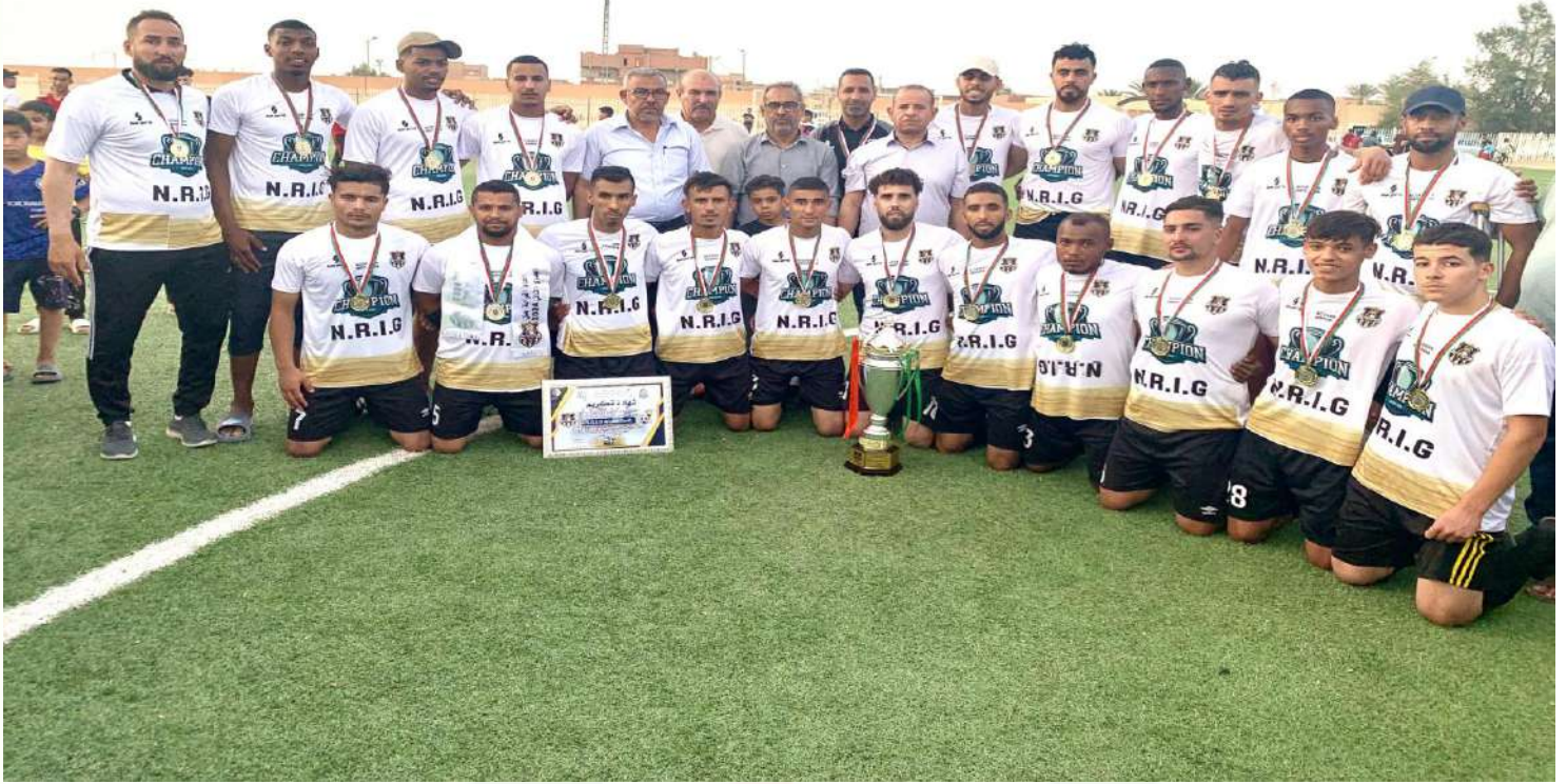
نتيجة فريق اتحاد الغرابة ببطولة الجهوي الثاني فوج "أ" للموسم الرياضي 2024/2023